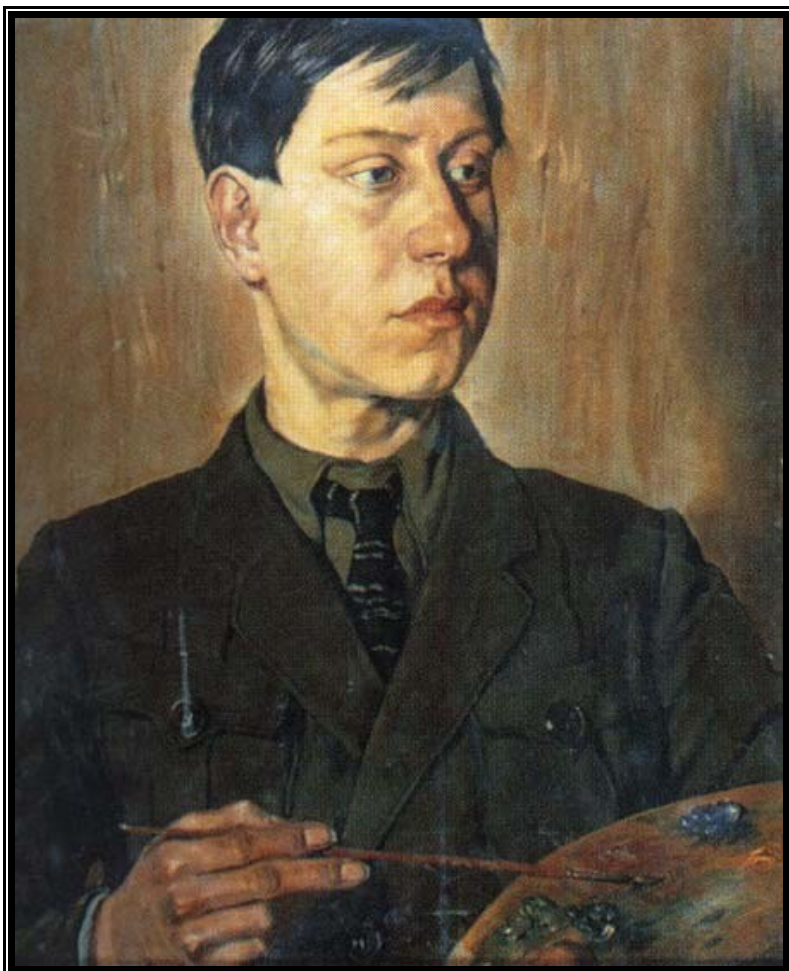
Ростислав Добужинский, 1921 г Портрет кисти Бенуа Н.А.

В годы 2-й мировой войны оставался в Париже и работал в области организации будущего международного телевидения, которое намечалось ввести в действие после окончания войны. Большое место в творческих занятиях Р.М. стал играть кинематограф и декоративное оформление интерьеров (заказы поступали как из европейских стран: Италии, Испании, Голландии, Германии и др., - так и из Америки).