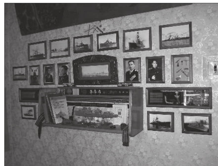
Домашний музей ВМФ семьи Валиевых.