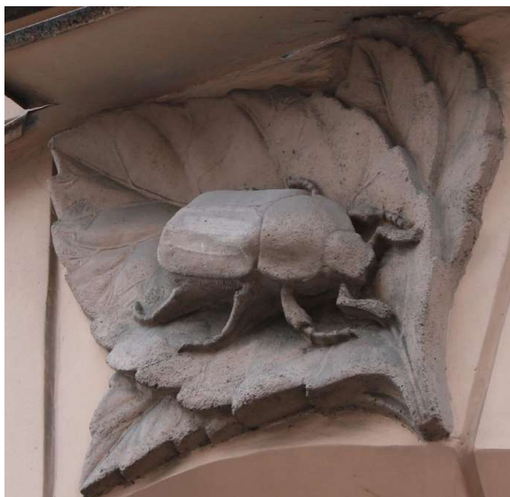
Майский жук – возрожденный барельеф на здании, где располагалась гимназия и реальное училище К. Мая.