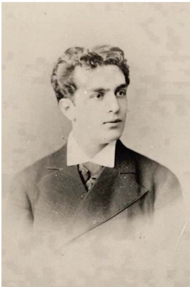
Юлиус Мариусович Петипа