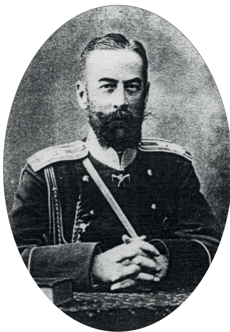
Христофор Платонович Дерфельден