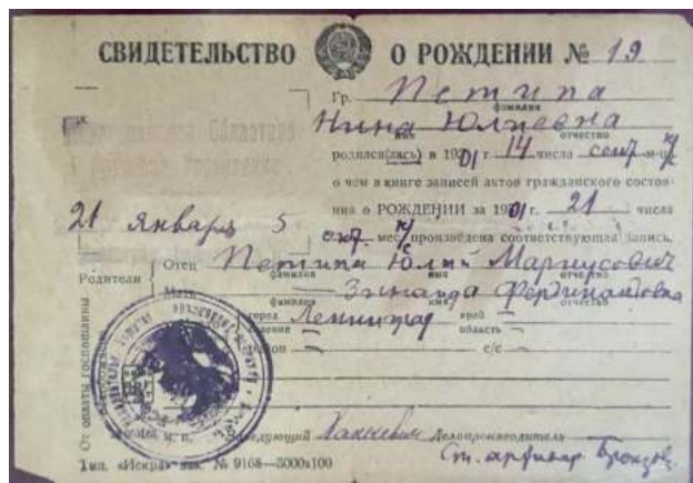
Метрическое свидетельство о рождении Нины Юльевны Петипа

Юлий (Юлиус) Петипа родился 12 мая 1876 года в Пятигорске [10]. В более поздних документах на оформление российского под-