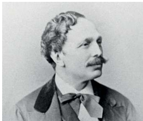
Мариус Иванович Петипа