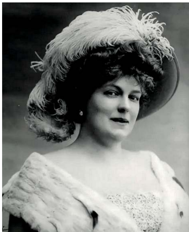
Мария Мариусовна Петипа [20]