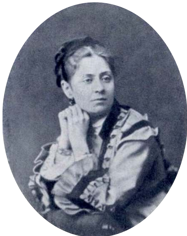
Любовь Леонидовна Савицкая [6]