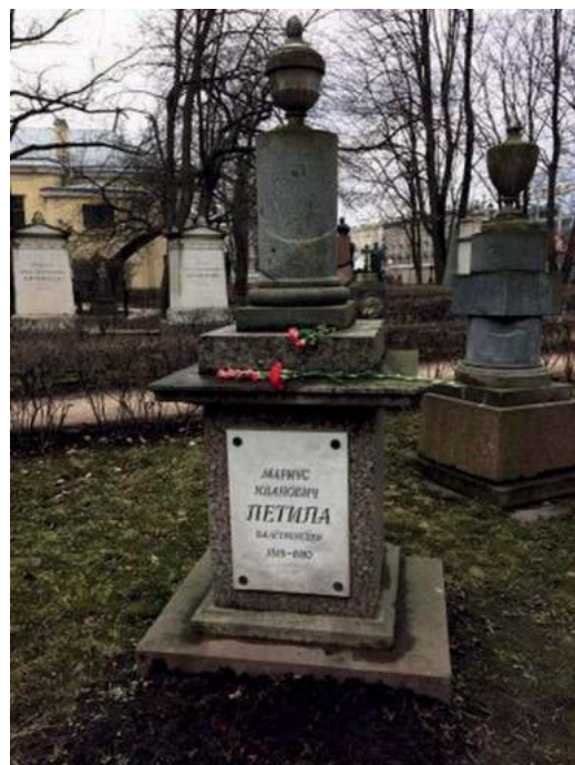
Памятник на могиле М.И. Петипа на Тихвинском кладбище Александро-Невской лавры

Ещё в детском возрасте Мариус Петипа начал выступать на сцене в балетах, поставленных его отцом. В молодости гастролировал с отцом во Франции, в США и в Испании. В 1847 году Мариус Петипа по приглашению российских властей приехал в Санкт-Петербург. Его дебют состоялся на сцене Петербургского Большого (Каменного) театра. В том же году он дебютировал и в качестве балетмейстера. С 1869 по