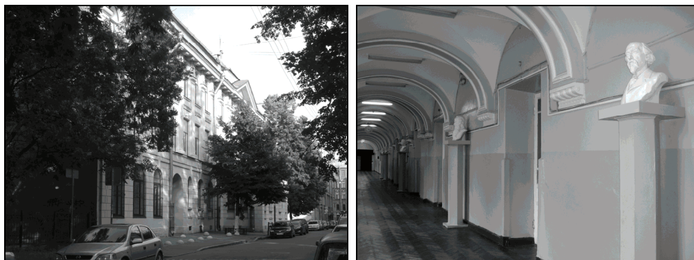
Ил. 6 и 7. Общеобразовательная школа № 47 им. Д. С. Лихачёва Петроградского района Санкт-Петербурга. Архитектор Г. Д. Гримм. 1905. Фотографии 2013 года

строили его на Плуталовой улице, дом 24, по его проекту [ил. 6–8]. Улицу при этом продлили до Большого проспекта Петроградской стороны, и в этом пространстве между Плуталовой и Бармалеевой улицами академик возвёл ещё и доходный дом, в котором сам и поселился.